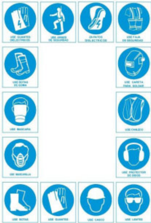
Imagen 3.- Señales obligatorias