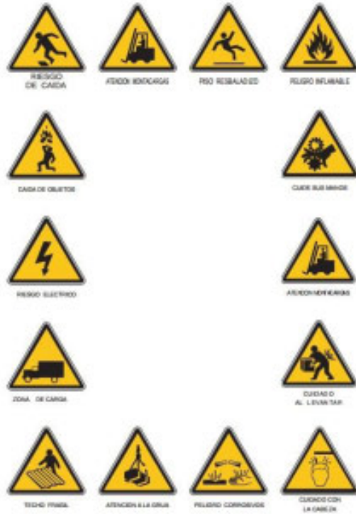
Imagen 4.- Señales de Advertencia