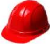
Tabla.- Clasificación del color del casco según la actividad.

Todos los cascos que sean utilizados durante la ejecución de los trabajos deberán cumplir con la normatividad vigente de acuerdo a la actividad.