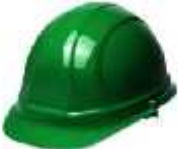
Tabla.- Clasificación del color del casco según la actividad.

Todos los cascos que sean utilizados durante la ejecución de los trabajos deberán cumplir con la normatividad vigente de acuerdo a la actividad.