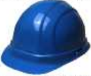
Tabla.- Clasificación del color del casco según la actividad.

Todos los cascos que sean utilizados durante la ejecución de los trabajos deberán cumplir con la normatividad vigente de acuerdo a la actividad.