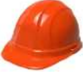
Tabla.- Clasificación del color del casco según la actividad.

Todos los cascos que sean utilizados durante la ejecución de los trabajos deberán cumplir con la normatividad vigente de acuerdo a la actividad.