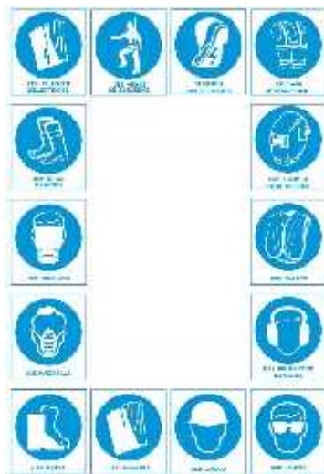
Imagen 3.- Señales obligatorias

La presencia de estas señales indica la proximidad y la naturaleza de un peligro difícil de ser percibido a tiempo. Están basadas en los peligros presentes en cada lugar, y las actividades que se van a desarrollar en la zona. Son de color amarillo y contraste negro. (Ver imagen 4).