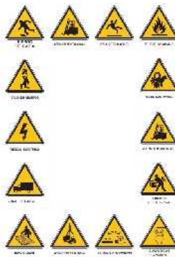
Imagen 4.- Señales de Advertencia